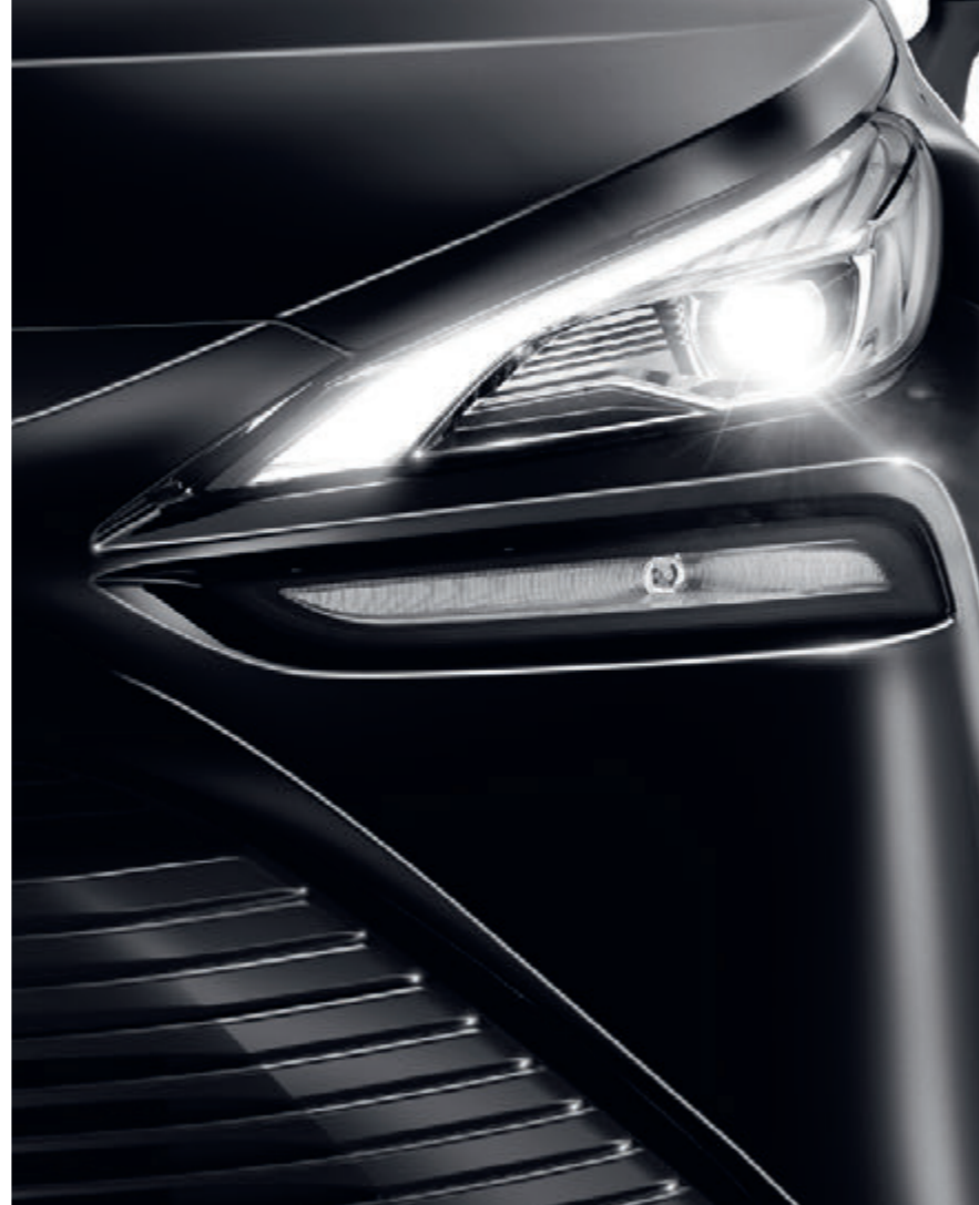
Elegante LED-Scheinwerfer inklusive Fernlicht-Assistent leuchten die Straße jederzeit optimal aus