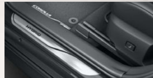
Einstiegsleisten Aluminium, vorne und hinten