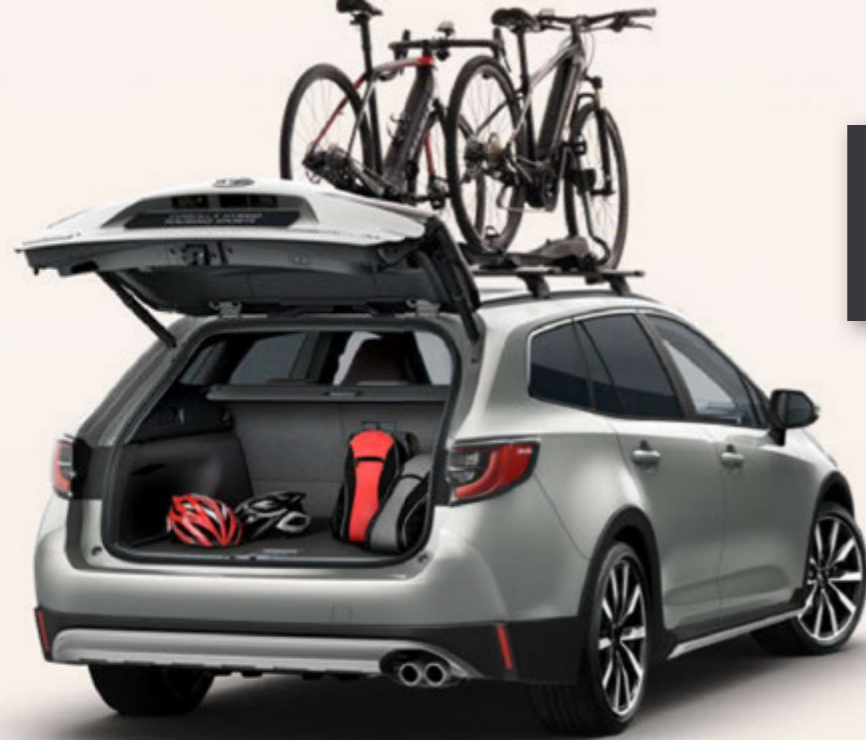
Fahrradträger ProRide (Abbildung ähnlich)

Weitere Informationen zu unserem TOYOTA ORIGINAL ZUBEHÖR finden Sie in unseren Preislisten oder auf toyota.de . Einfach den QR-Code scannen und Topangebote entdecken.