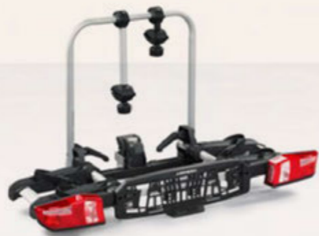
Heckfahrradträger Arimero 402 Geeignet für zwei Fahrräder