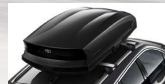
Dachbox mit Querträger (Corolla Touring Sports)