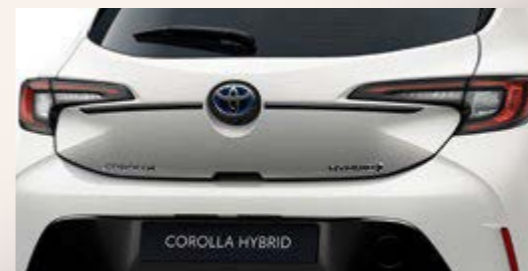
Obere Heckklappen-Zierleiste, verchromt (5-Türer)