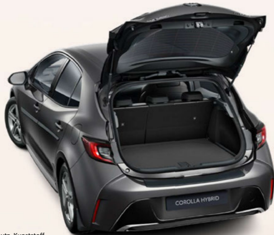
Ladekantenschutz, Kunststoff (5-Türer)

Design, Komfort und Sicherheit: Ihr Corolla glänzt bereits durch unvergleichliche Qualitäten. Dank Toyota Original-Zubehör Ihres Toyota Partners können Sie Ihren Corolla noch weiter perfektionieren, bis er Ihren Wünschen und Bedürfnissen exakt entspricht.