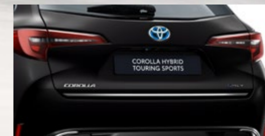
Untere-Heckklappen-Zierleiste, verchromt (Corolla Touring Sports)