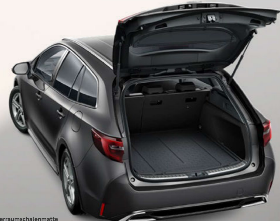
Kofferraumschalenmatte (Corolla Touring Sports)