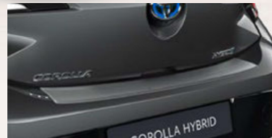
Ladekantenschutz, Edelstahl (5-Türer)