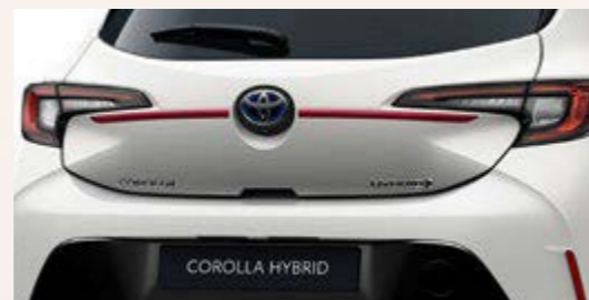
Obere Heckklappen-Zierleiste (5-Türer)