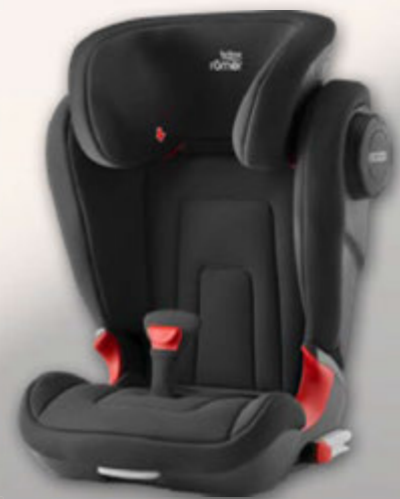
Kindersitz (Abbildung ähnlich)