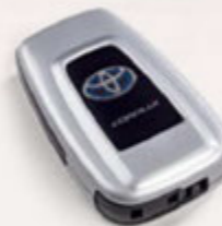
Smart Key Cover Mit Hybrid-Schriftzug