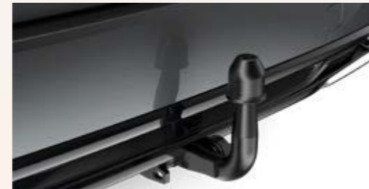
Anhängerzugvorrichtung (Corolla Touring Sports)