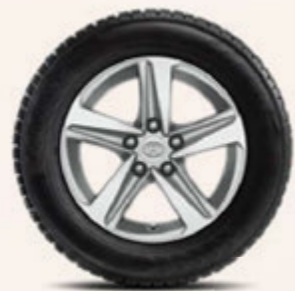
16-Zoll-Winterkomplettrad, silbern oder schwarz