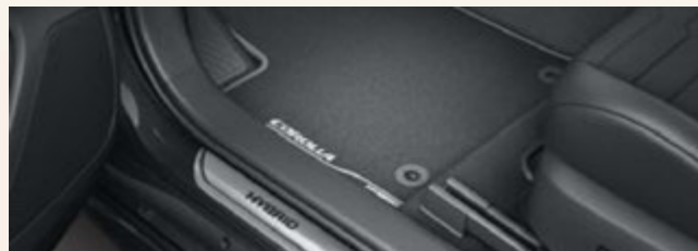
Fußmatten aus Velours