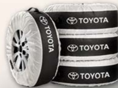
Reifensäcke Mit Toyota Schriftzug