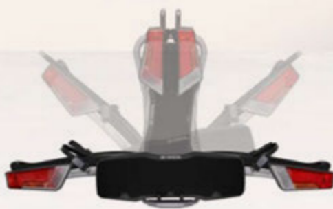
Thule Heckfahrradträger, faltbar