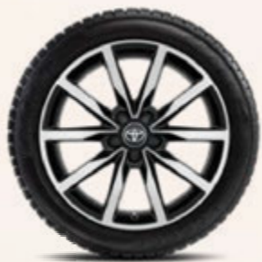
18-Zoll-Winterkomplettrad, schwarz frontpoliert