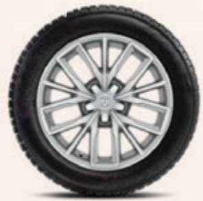
17-Zoll-Winterkomplettrad, silbern oder schwarz