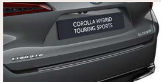
Ladekantenschutz, Edelstahl (Corolla Touring Sports)