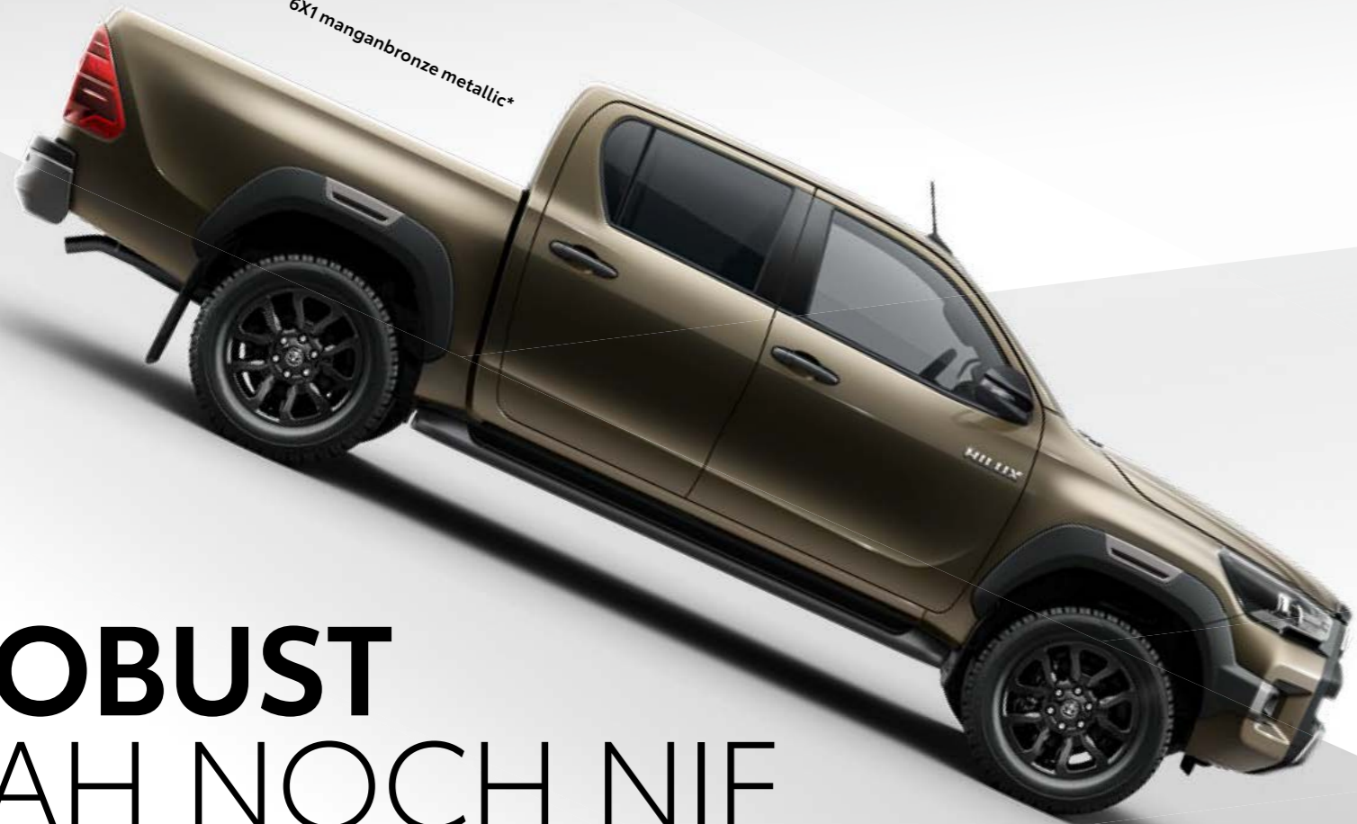
6X1 manganbronze metallic*