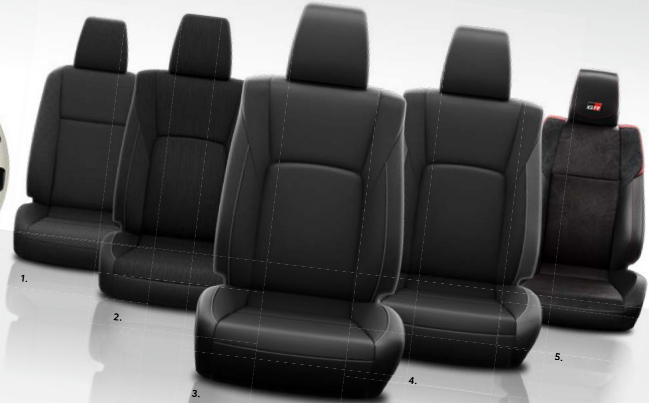
1. Stoffsitze, schwarz, oval gemustert für Ausstattung Duty 2. Stoffsitze, schwarz, vertikal gestreift für Ausstattung Comfort und Executive/ Invincible (Extra Cab)