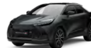
2NB marlingrau metallic 2)