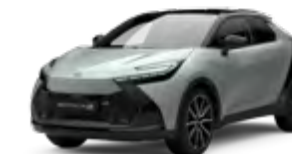
2VF dynamic grey metallic 2)