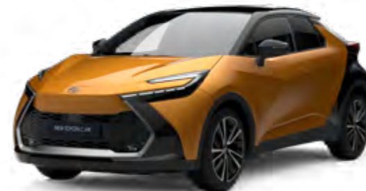
2YT sulfurgold metallic 2)