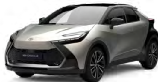
2MR cosmic silber metallic 2)