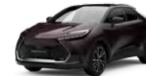
2XE dunkel amethyst metallic 1)