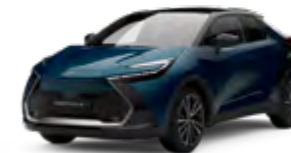
2YB dunkel türkisblau metallic 2)