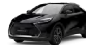
209 mysticschwarz mica 2),3)