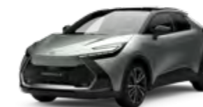
2VU shimmering silber metallic 1)