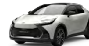
2VP platinumweiß perleffekt 2)