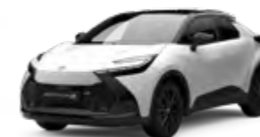
2MQ schneeweiß 1)