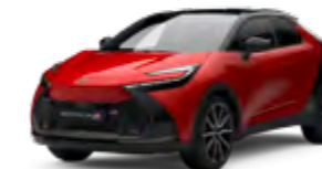
2TB karminrot metallic 1)