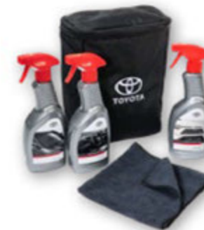
TOYOTA CARE KIT

Die Kühlbox verfügt über ca. 7,5 Liter Innenvolumen und wird mit dem Sicherheitsgurt befestigt.