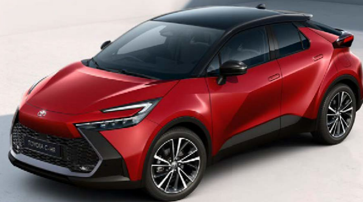
Abbildung zeigt Sonderausstattung: Metalliclackierung ist optional.

Der Toyota C-HR Lounge: unwiderstehlich chic außen und innen – die komfortable Topvariante kommt mit prägnanten 19-Zoll-Felgen sowie modernen LED-Scheinwerfern und sorgt mit einem stilvollen Lichtkonzept für ein Wohlfühlambiente.