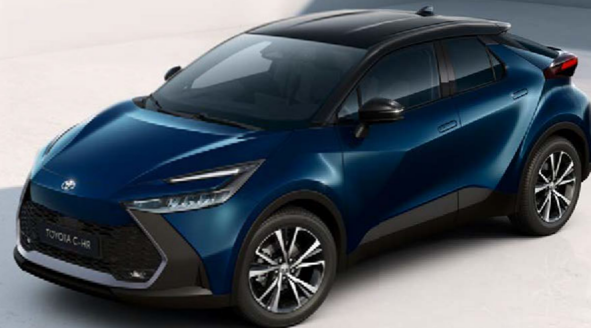
Abbildung zeigt Sonderausstattung: Metalliclackierung ist optional.

Der Toyota C-HR Team Deutschland: auffallend attraktiv mit bestem Preis-Leistungs-Verhältnis – die Zweifarblackierung unterstreicht das charakterstarke Design und das große Multimediadisplay erleichtert die Navigation.