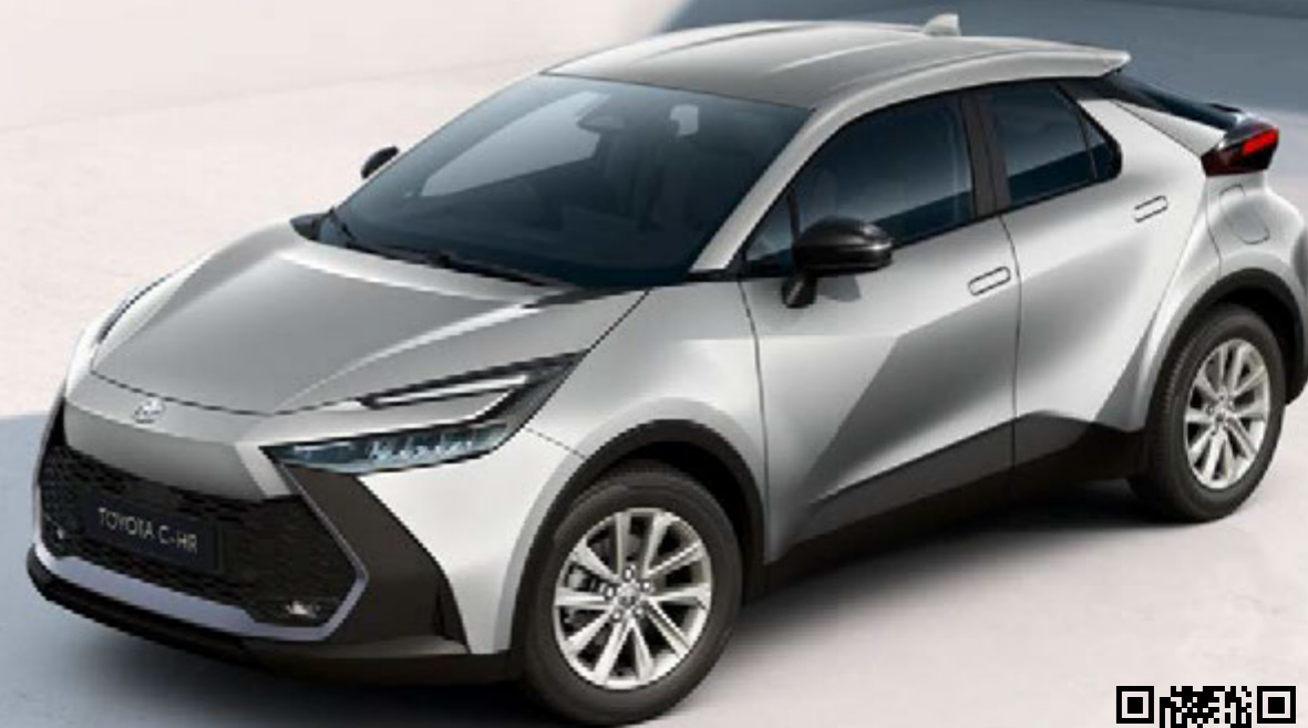
Abbildung zeigt Sonderausstattung: Metalliclackierung ist optional.

Der Toyota C-HR Flow: von Grund auf sicher und smart – inklusive umfangreicher Fahrassistenzsysteme, eines komplett digitalen Cockpits und eines Multimediasystems mit Cloud-Navigation.