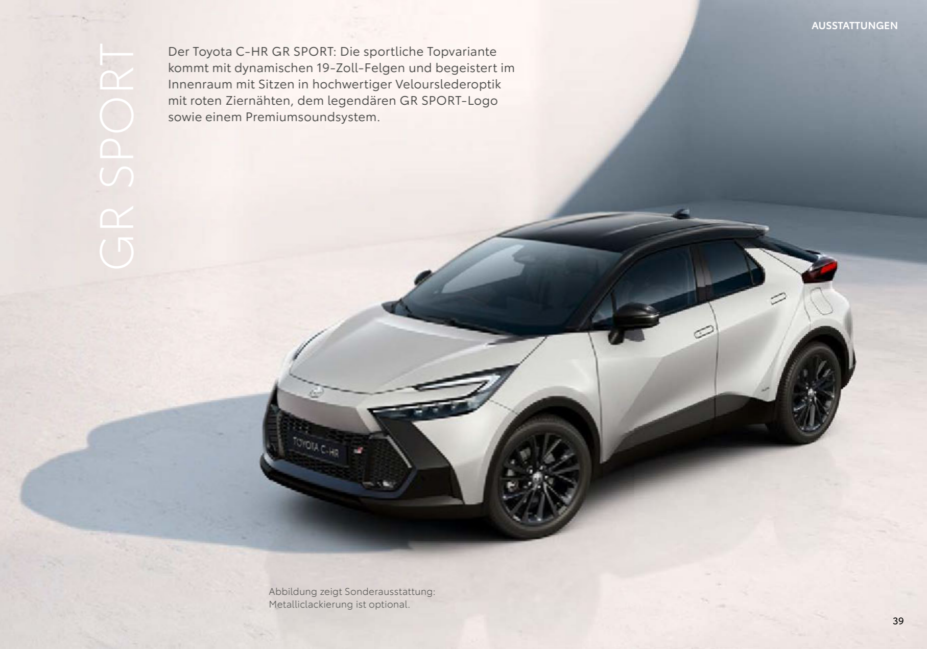
Abbildung zeigt Sonderausstattung: Metalliclackierung ist optional.

Der Toyota C-HR GR SPORT: Die sportliche Topvariante kommt mit dynamischen 19-Zoll-Felgen und begeistert im Innenraum mit Sitzen in hochwertiger Velourslederoptik mit roten Ziernähten, dem legendären GR SPORT-Logo sowie einem Premiumsoundsystem.