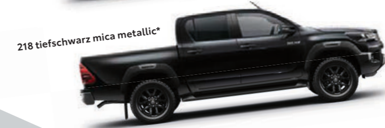
218 tiefschwarz mica metallic*