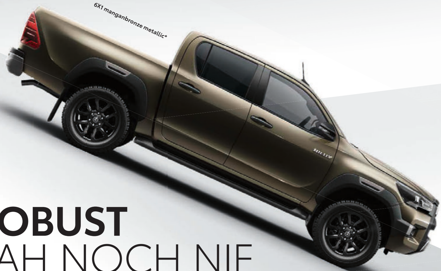
6X1 manganbronze metallic*