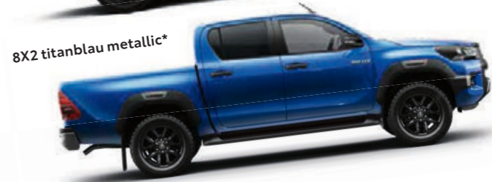
8X2 titanblau metallic*