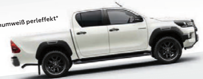
089 platinumweiß perleffekt*