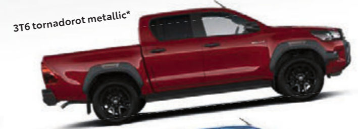
3T6 tornadorot metallic*