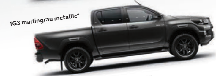
1G3 marlingrau metallic*