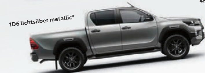
1D6 lichtsilber metallic*