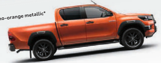
4R8 inferno-orange metallic*