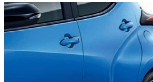
SCHUTZFOLIEN TÜRGRIFFMULDEN, TRANSPARENT