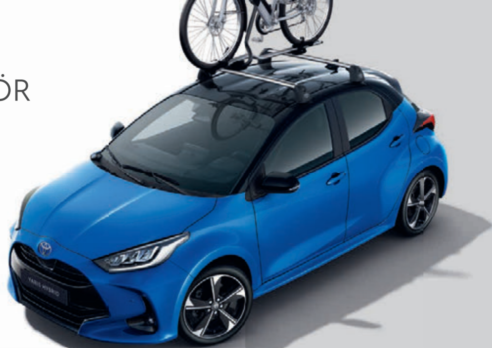
DACHBASISTRÄGER INKL. FAHRRADTRÄGER PRORIDE

Maßgeschneidertes Zubehör in 100%iger Toyota Qualität setzt interessante Akzente und bringt Ihre Individualität noch besser zum Ausdruck.