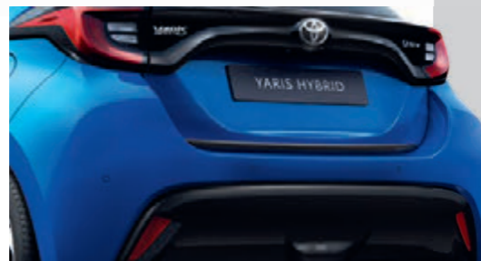
UNTERE HECKKLAPPEN-ZIERLEISTE, SCHWARZ