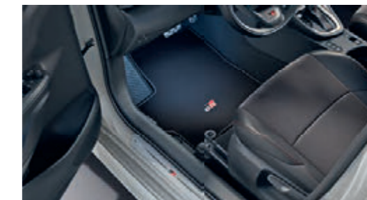
FUSSMATTEN, VELOURS MIT GR-LOGO

Weitere Informationen zu unserem TOYOTA ORIGINAL ZUBEHÖR finden Sie in unseren Preislisten oder auf toyota.de . Einfach den QR-Code scannen und Topangebote entdecken.