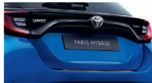
LADEKANTENSCHUTZ, AUS KUNSTSTOFF, SCHWARZ