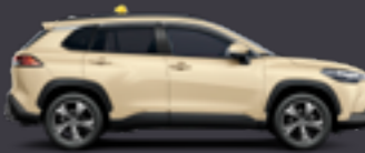
Corolla Cross Hybrid

Stromverbrauch Toyota Proace Verso Electric, 100 kW (136 PS), Batteriekapazität: 75 kWh vollelektrisch: kombiniert: 27,9–26,9 kWh/100 km; CO 2 -Emissionen: 0 g/100 km; elektrische Reichweite (EAER): 312–303 km; elektrische Reichweite (EAER City): 423–394 km. Werte gemäß WLTP-Prüfverfahren. Stromverbrauch Toyota Proace City Verso Electric, 100 kW (136 PS), Batteriekapazität: 50 kWh vollelektrisch: kombiniert: 20,4–19,9 kWh/100 km; CO 2 -Emissionen: 0 g/100 km; elektrische Reichweite (EAER): 264–284 km; elektrische Reichweite (EAER City): 373–425 km. Werte gemäß WLTP-Prüfverfahren.