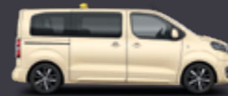
Proace Verso Electric