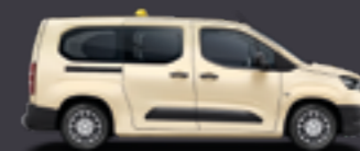
Proace City Verso Electric