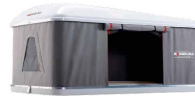
Hartschalendachzelt AIRLANDER** PLUS medium, Ansicht von rechts/hinten