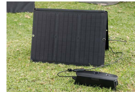
CS* Free Solar Panel Ladekit

Verwendet einen wasserdichten MC4-Anschluss, sodass Sie das Panel bis zu 30 Minuten lang in Wasser eintauchen können, ohne dass das Produkt Schaden nimmt (IP67 zertifiziert).