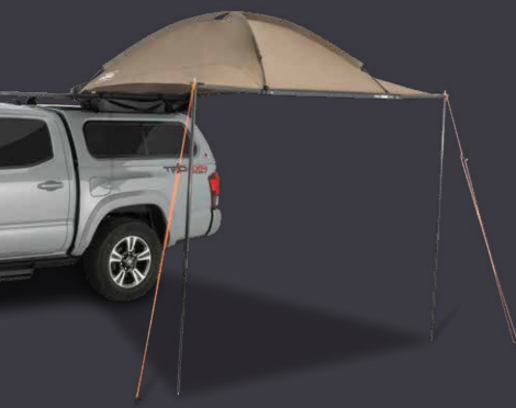
Trapezmarkise Kuppelmarkise SUNSEEKER*