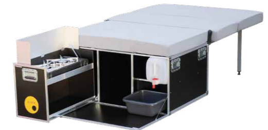
QUQUQ** Camping-Box Proace und Proace Verso NEU: Mit oder ohne Kühlbox-Auszug erhältlich Abb. zeigt 2-Flamm-Kocher