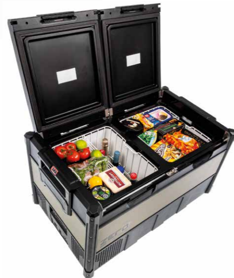
ARB® Kühlbox ZERO DUAL 96 Liter