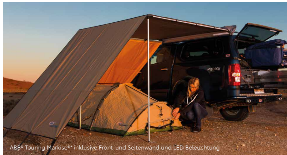
ARB® Touring Markise** inklusive Front- und Seitenwand und LED Beleuchtung

Perfekt für eine kleine Pause: im Schatten. Die ARB® Markise aus hochwertigem Polyurethan-beschichtetem 300-D-Oxford-Polyester. Zu zwei der drei Markisen sind passende Seiten und Frontwände bestellbar, die Sie zusätzlich vor Wind schützen.