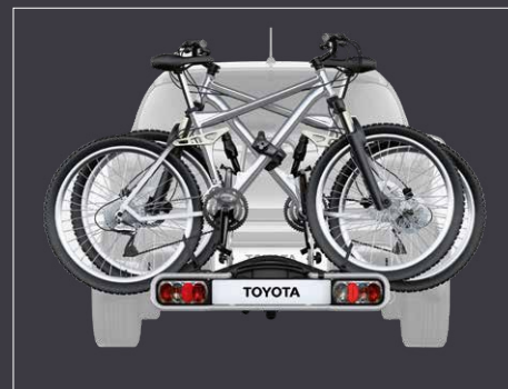
Faltbarer Heckfahrradträger, THULE**