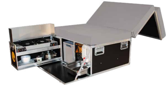
QUQUQ** Camping-Box Proace City Verso Mit oder ohne Kühlbox-Auszug erhältlich Abb. zeigt 2-Flamm-Kocher