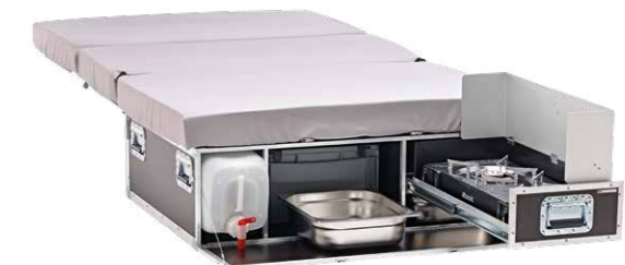
QUQUQ** Camping-Box für den Land Cruiser Abb. zeigt 2-Flamm-Kocher

*Es handelt sich hier um Zubehör(e) von sorgfältig ausgesuchten Lieferanten, die unter ihrem jeweiligen Markennamen gezeigt werden. Individuelle Preise und Angebote erhalten Sie bei Ihrem Toyota Vertragspartner.