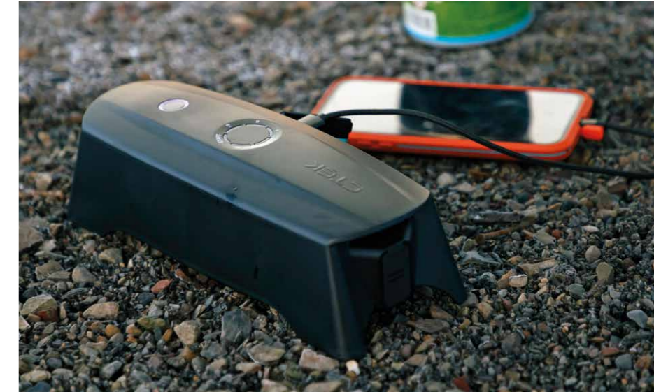
CS* Free Powerbank