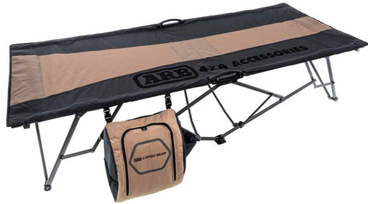
ARB® Feldbett, inkl. Schuhtasche, für bis zu 150 kg