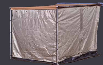
ARB® Deluxe Markisenzelt*