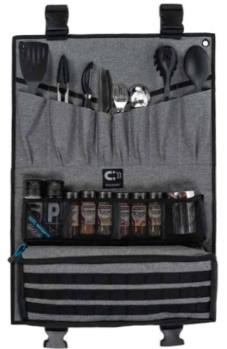
Navigator® Faltbare Besteck- und Gewürztasche, 70x50cm (Kitchen Buddy)

*Es handelt sich hier um Zubehör(e) von sorgfältig ausgesuchten Lieferanten, die unter ihrem jeweiligen Markennamen gezeigt werden. Individuelle Preise und Angebote erhalten Sie bei Ihrem Toyota Vertragspartner.