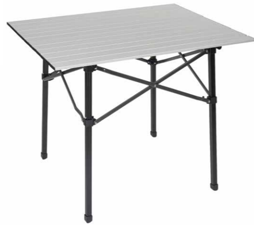
ARB® Aluminiumklapptisch, inkl. Tragetasche

*Es handelt sich hier um Zubehör(e) von sorgfältig ausgesuchten Lieferanten, die unter ihrem jeweiligen Markennamen gezeigt werden. Individuelle Preise und Angebote erhalten Sie bei Ihrem Toyota Vertragspartner.