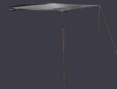
Rhino Rack SUNSEEKER Markise*