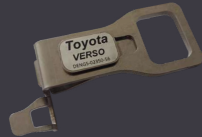
Heckfensteraufsteller (für Proace City Verso und Proace Verso), eignet sich auch als Flaschenöffner