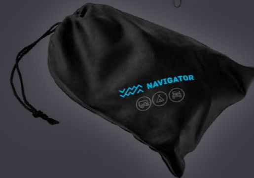
Navigator® Abspanngurte, 2 Stück, für Markise (Twin Pack Awning Buddy)