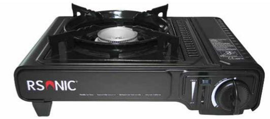
1-Flamm-Kocher in QUQUQ** Camping-Box