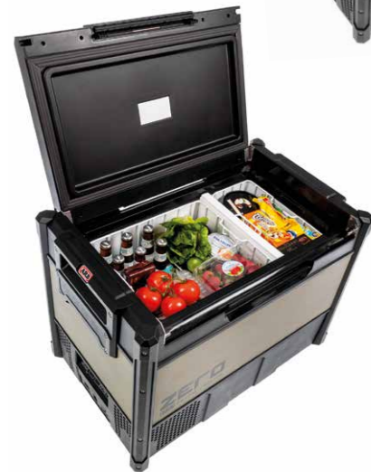
ARB® Kühlbox ZERO DUAL 69 Liter