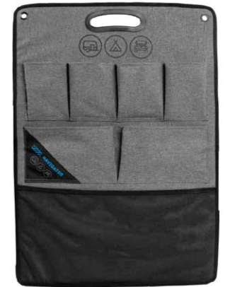
Navigator® Universal Packtasche, 70x50cm (Outdoor Storage Buddy)