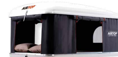
Hartschalendachzelt AIRTOP** medium, Ansicht von rechts/hinten