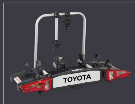
Faltbarer Heckfahrradträger, Uebler i21