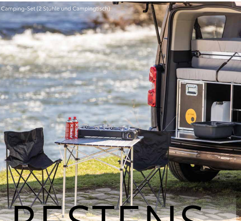
Camping-Set (2 Stühle und Campingtisch)