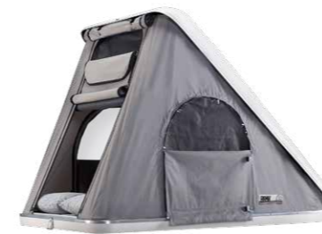
Hartschalendachzelt COLUMBUS** Variant medium, Ansicht von rechts