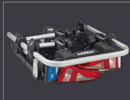
Faltbarer Heckfahrradträger, Uebler i31