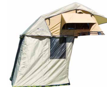
ARB® Dachzelt Simpson III*, inklusive Anbau, Ansicht von rechts